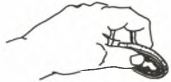
在敬拜時我們奉獻

學習神的話語是敬拜神的其中一項途徑。我們若渴慕明白神的旨意，並能把它行出來，便會得着主所賜與的最大福氣（約翰福音7：17）。因此聖靈形容庇哩亞城的信徒賢明，因為他們“天天考查聖經”（使徒行傳17：11-12）。