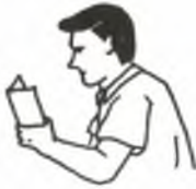
在敬拜時我們學習

們（約翰一書5：14）。同時，祂也會答覆我們的禱告（彼得前書3：12）。禱告並不是強求與神的旨意違背的事物，而是承認我們對神的信靠和仰賴。我們應當常常憑着信心禱告，並且相信我們所求的必會得着。但我們應常常這樣說，“不要成就我的意思，只要成就你的意思”（路加福音22：42）。我們在禱告中要奉基督的名祈求，因為祂是神和我們之間的中保（提摩太前書2：5；以弗所書5：20）。